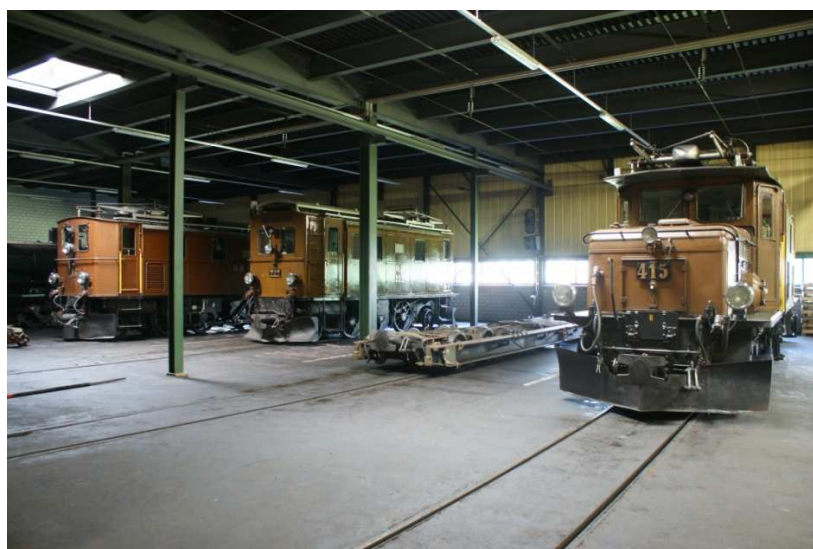
RhB-Oldtimer-Parade im Depot Samedan.