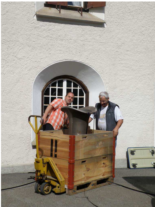
Der spannende Moment...