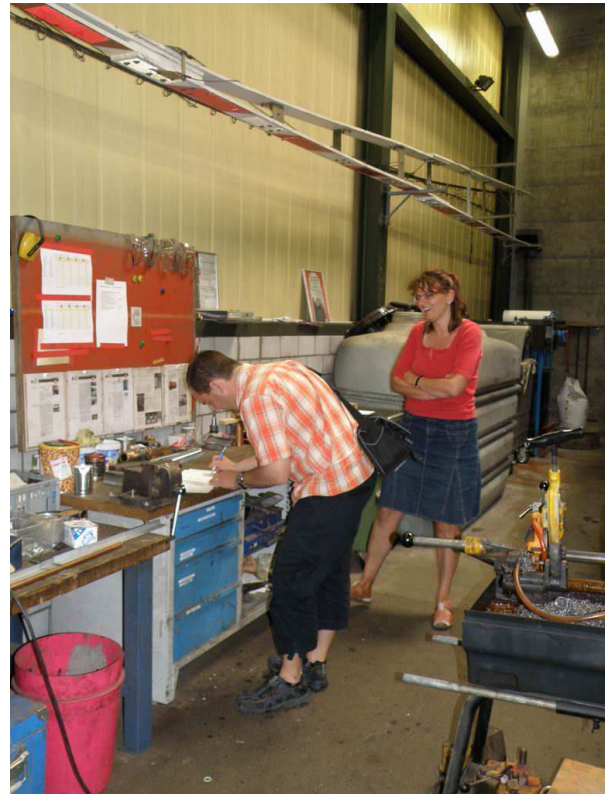
Der Kaufvertrag für die Ersatzteile wird unterschrieben.