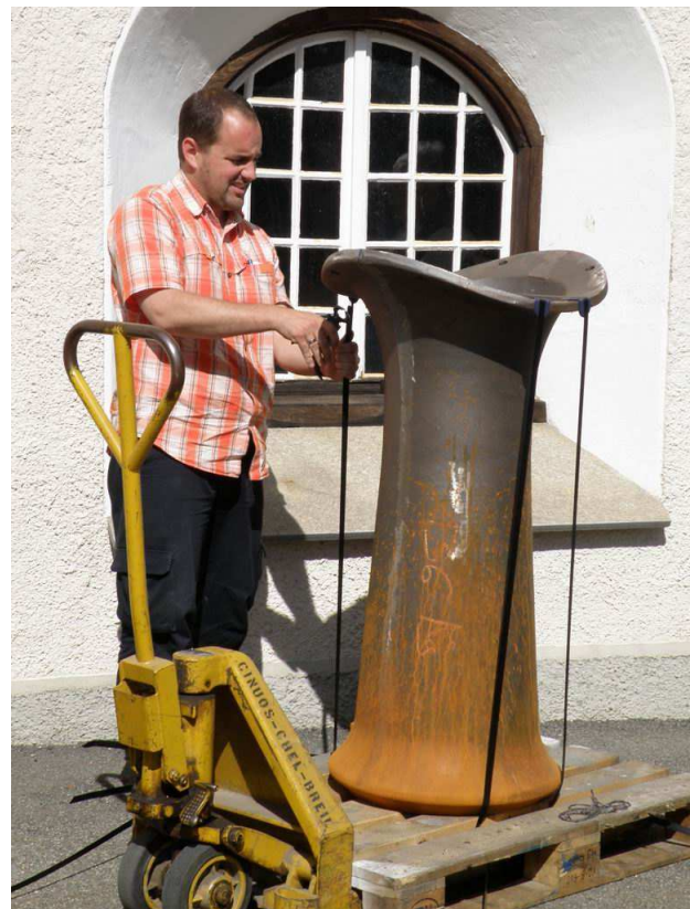
Voilà, unser neuer Kamin!