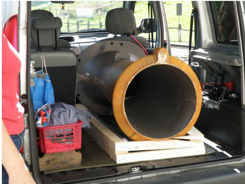
Bereit zum Abtransport.